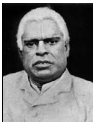
ŠRÍLA BHAKTIVINÓDA THÁKURA (1838–1914)

Šrīla Bhaktivīnōda Thākura se narodil v roce 1838 v Západním Bengálsku, v Indii. Jako malý chlapec se velmi zajímal o duchovní témata a povahu Nejvyšší Reality. Byl pevně přesvědčen o existenci monoteistického, osobního Boha.