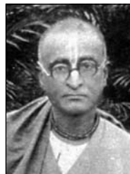
ŠRÍLA BHAKTISIDDHÁNTA SARASVATÍ THÁKURA (1874–1937)

Bhaktivīnōda Thākura napsal mnoho knih (některé i v anglickém jazyce), písní a článků o vaišnavismu a filozofii Šrī Čaitanji. Byl také otcem Bhaktisiddhānty Sarasvatího, jenž se měl stát nejvýznamnějším světcem a učitelem bhakti-jógy 20. století.